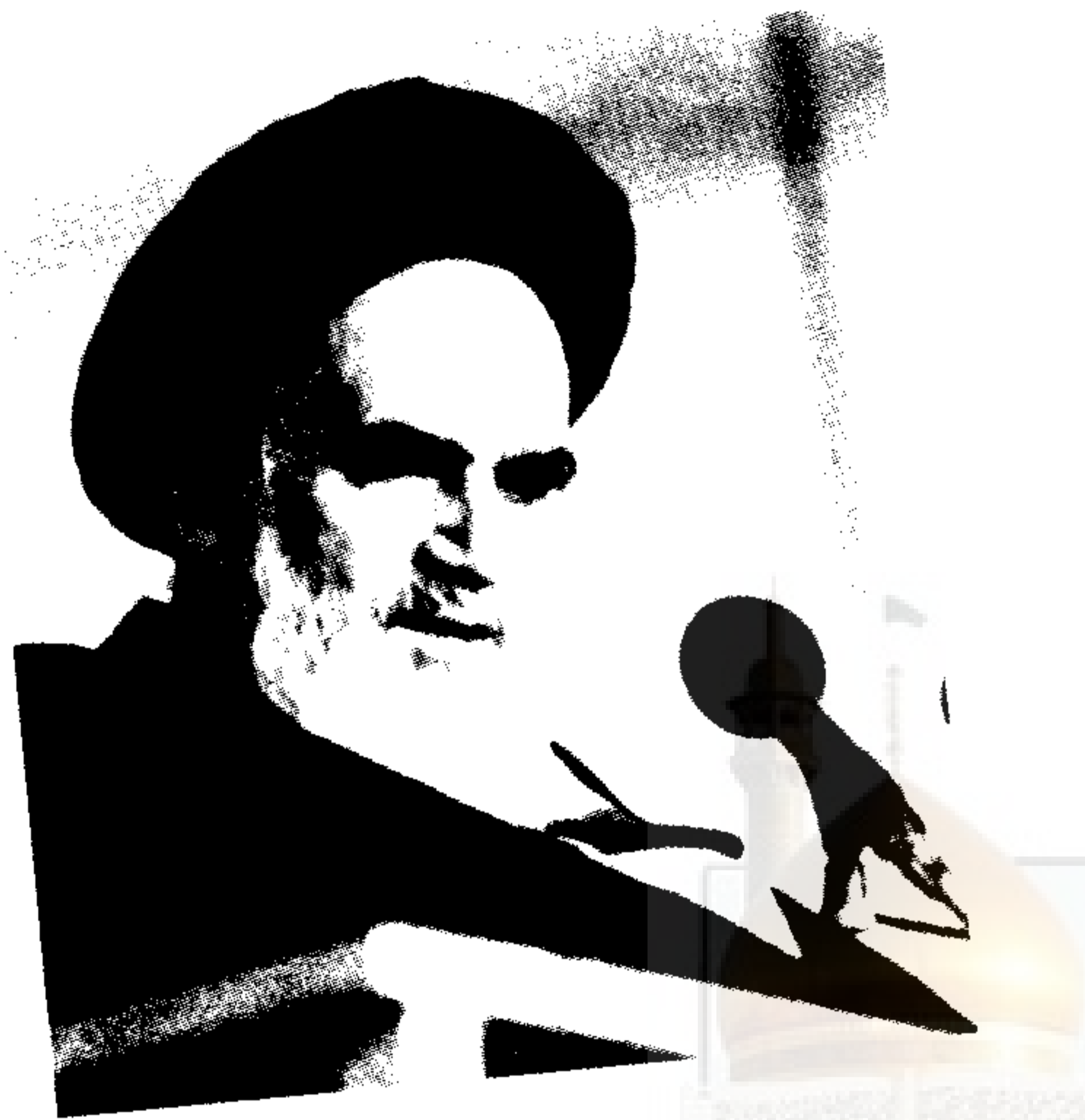
อิมามโคมัยนี (ร.ฮ.)

การเอาใจใส่ต่อเรื่องราวทางจิตวิญญาณอันสูงส่ง ปฏิบัติภารกิจ และมารยาทตามแบบอิสลาม ไม่ลืมนี่ที่จะสนใจในแง่มุมทางการเมือง สังคมของพิธีฮัจญ์ด้วย อุลมะฮาดผู้ยิ่งใหญ่ และนักพูดที่น่านับถือจักต้องสร้างจิตสำนึกแก่มุสลิมทุกคนให้รู้จักแง่มุมทางการเมือง และหน้าที่ที่สำคัญของพวกเขา หน้าที่อันละเอียดอ่อนและสำคัญเช่นที่วอนี้ ถ้ามุสลิมทั้งหลายได้เพียรพยายามเอาใจใส่ และทำให้เป็นผลแล้วละก็ ความยิ่งใหญ่ที่พระเจ้าเป็นผู้เป็นเจ้าของได้มอบให้กับมุอ์มินทุกคนก็จะกลับคืนมาอีกครั้งหนึ่ง และพวกเขาจักจะพบกับการมีเกียรติตามทัศนะของอิสลาม อันเป็นสิทธิ์เฉพาะของมวลมุสลิม พวกเขาจะประสบกับการคุ้มครองของ