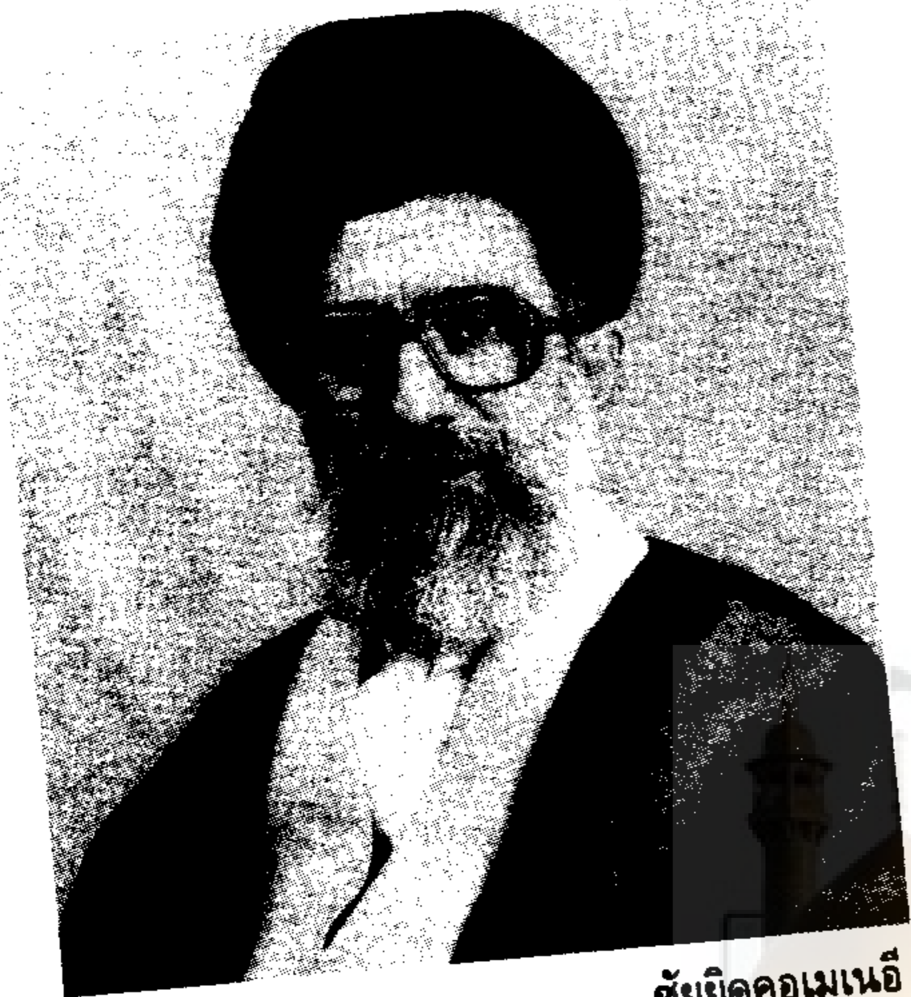
ชัยยิดคอบเนอีย์

อำนาจบาตรใหญ่ การรุกรานและการเป็นศัตรู สร้างความโสมมให้กับสภาพแห่งการดำรงชีวิตที่บังเกิดขึ้นแก่มวลมนุษย์และประชาชาติของเขา พวกเขาต้องสังเวชชีวิตและทรัพย์สินด้วยการสงคราม การกดขี่ การการรุกรานและการทำลายล้าง