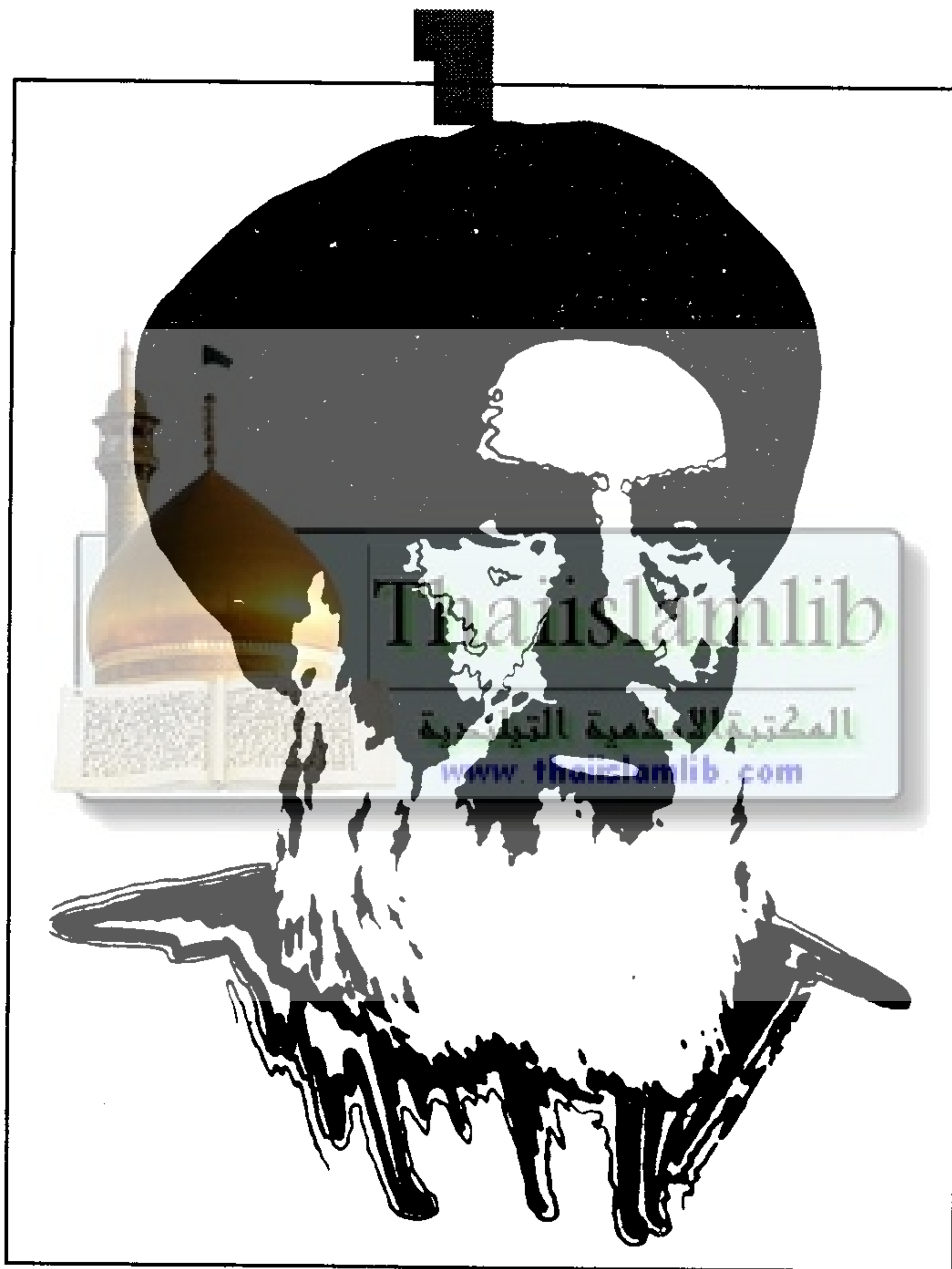
ฮัรฟุดดีน

ท่านชัยยิด ฮัรฟุดดีน เป็นอุลามานักต่อสู้คนสำคัญท่านหนึ่งของโลกอิสลาม ซึ่งวิธีการต่อสู้ของท่าน โดยเฉพาะต่อจักรวรรดินิยมและประเทศผู้ล่าอาณานิคมตะวันตกนั้นได้เป็นแนวทางการต่อสู้ของบรรดานักต่อสู้เพื่ออิสลามทั้งหลายในเวลาต่อมาจนปัจจุบัน รวมทั้งการต่อสู้ของท่านอิมามโคมัยนี ท่านชัยยิด ฮัรฟุดดีน เป็นมุสลิมเกิดในเลบานอน ท่านได้ต่อสู้เพื่อเลบานอนและเพื่อโลกอิสลามทั้งมวล ซึ่งมุสลิมทั้งสามทวีปตั้งแต่แอฟริกา ยุโรป และเอเชียมีความประทับใจต่อบทบาทการต่อสู้ของท่าน และชื่อเสียงของท่านนั้นเป็นอมตะอยู่เคียงคู่ประวัติศาสตร์ของอิสลามท่านหนึ่ง ท่านชัยยิด ฮัรฟุดดีน อัสญญกรรมในปีฮิจเราะฮ์ 1377 (ค.ศ.1956) ที่กรุงเบรุต เลบานอน เมื่ออายุของท่านได้ 87 ปี